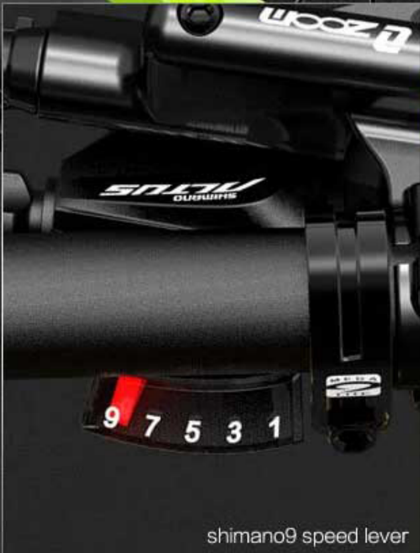
shimano9 speed lever

27-SPEED TRANSMISSION SYSTEM SHIMANO IMPORTED FROM JAPAN