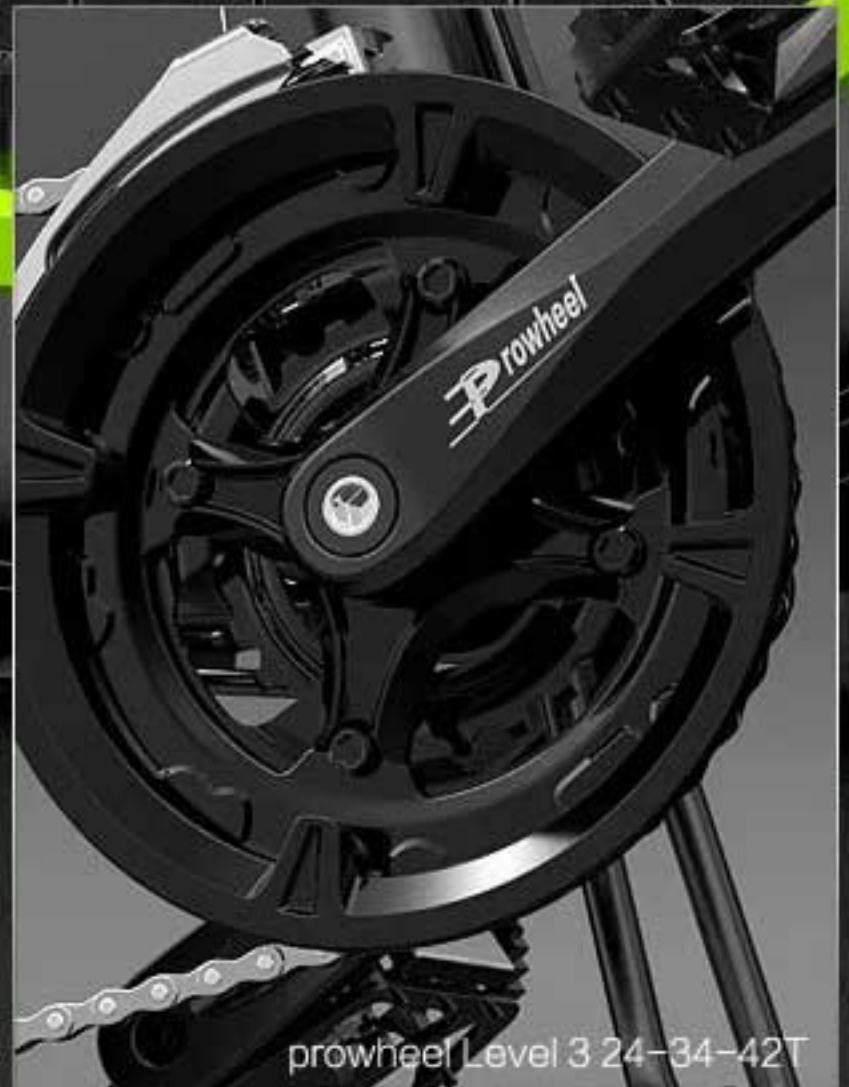
prowheel Level 3 24-34-42T